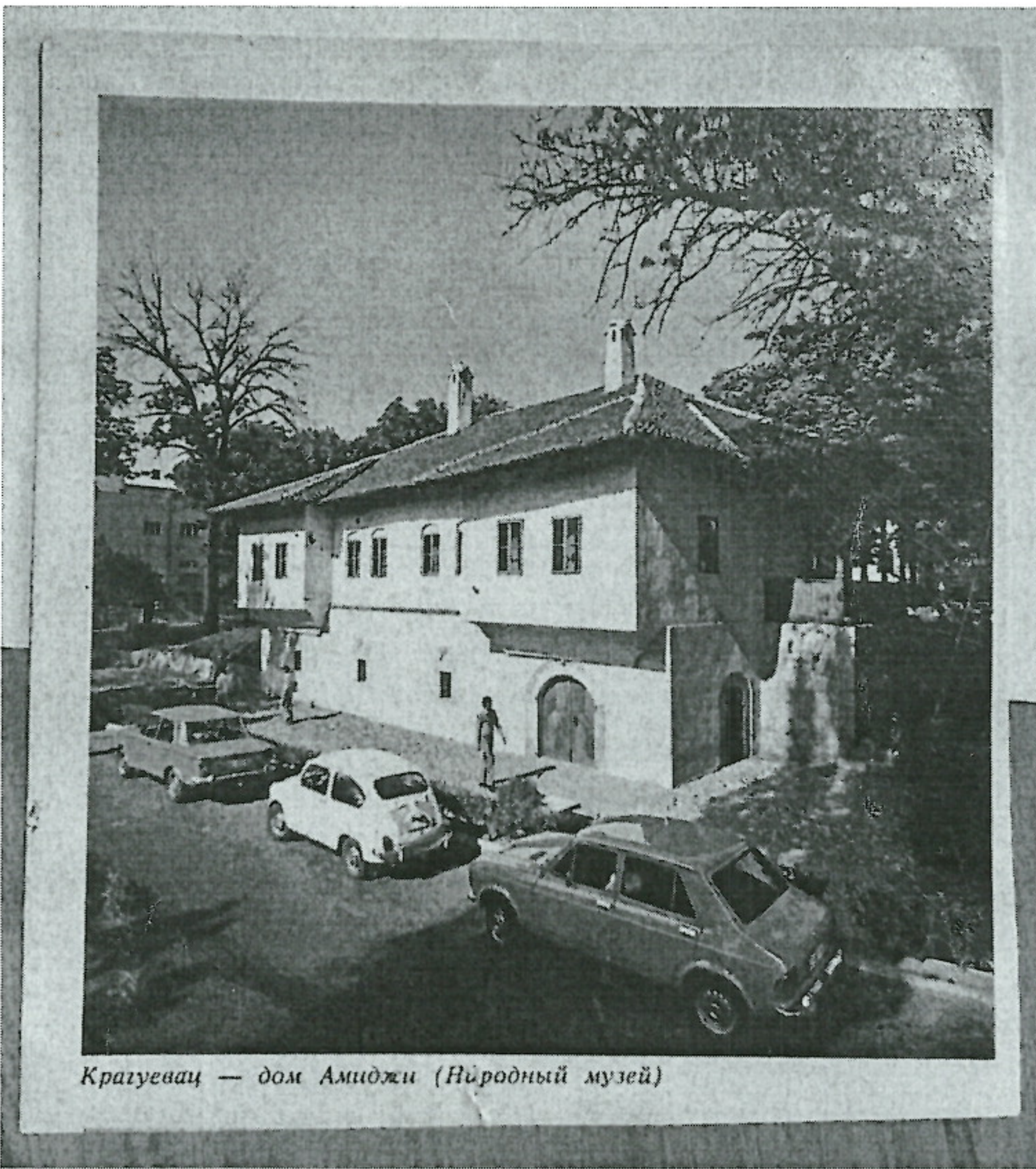
Крагуевац — дом Амиджи (Натурални музеј)