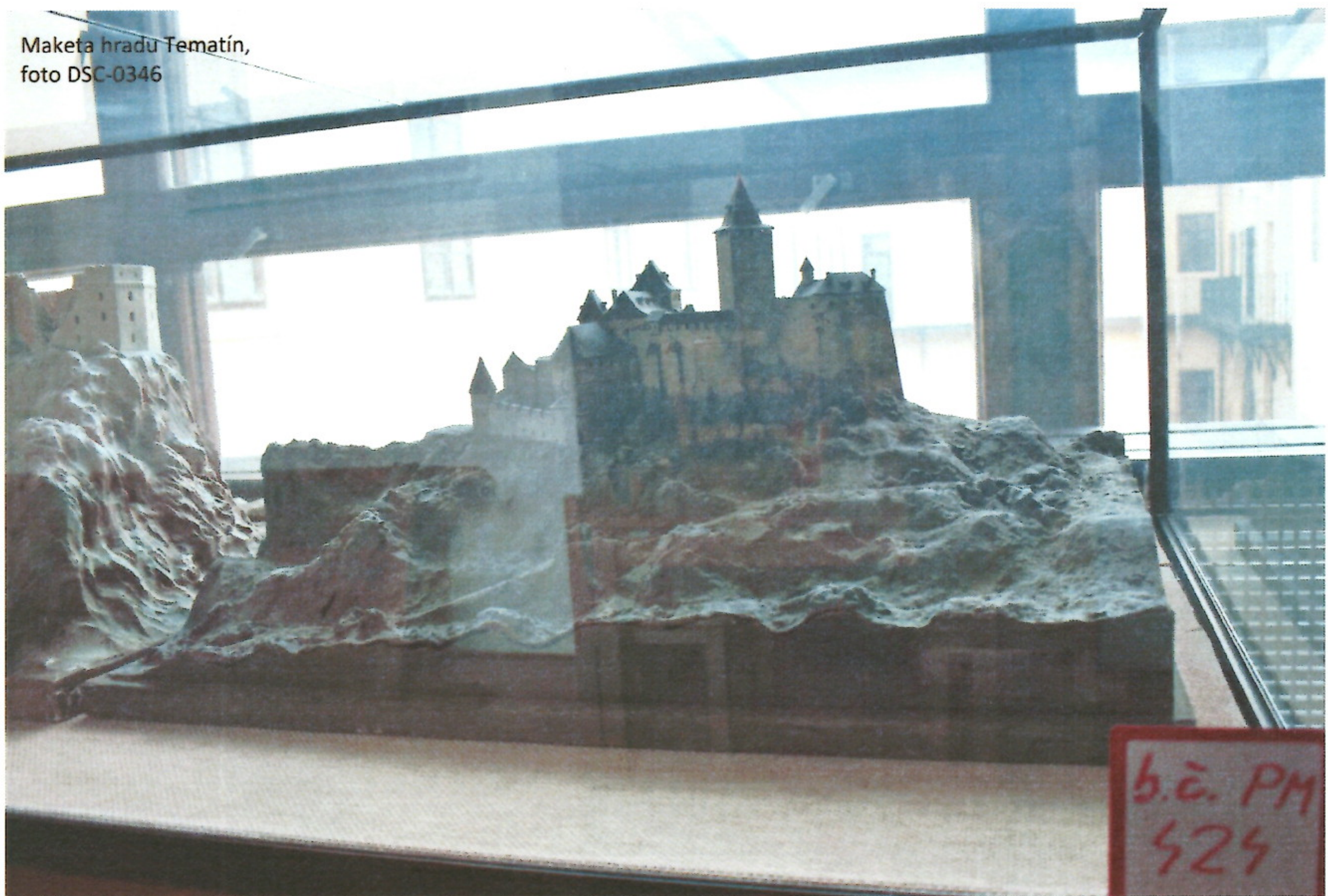
Maketa hradu Tematín, foto DSC-0346