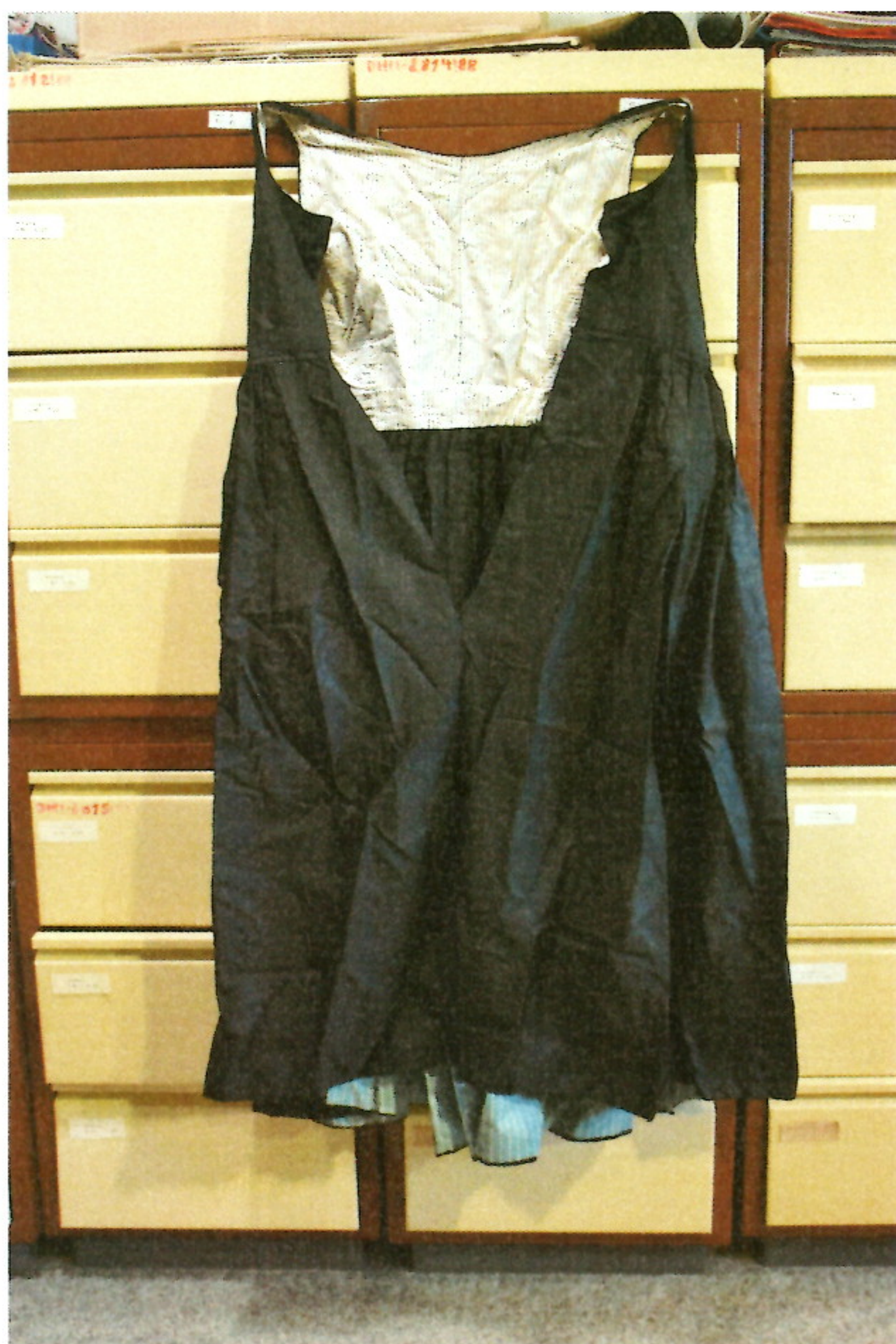
b) Sukňa so živôtikom